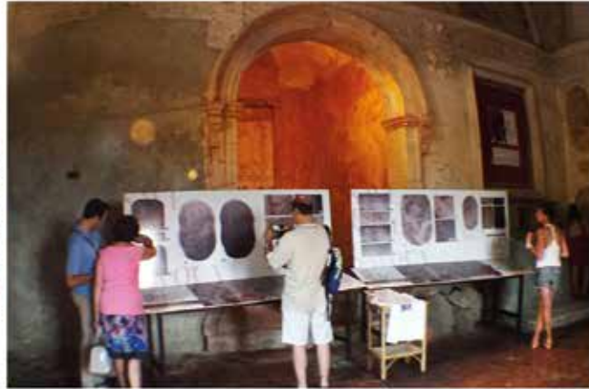
Fig. 8 - Chiesa di San Michele, Savoca. Conferenza per il lancio della campagna di crowdfunding e pannelli illustrativi della campagna di diagnostica.