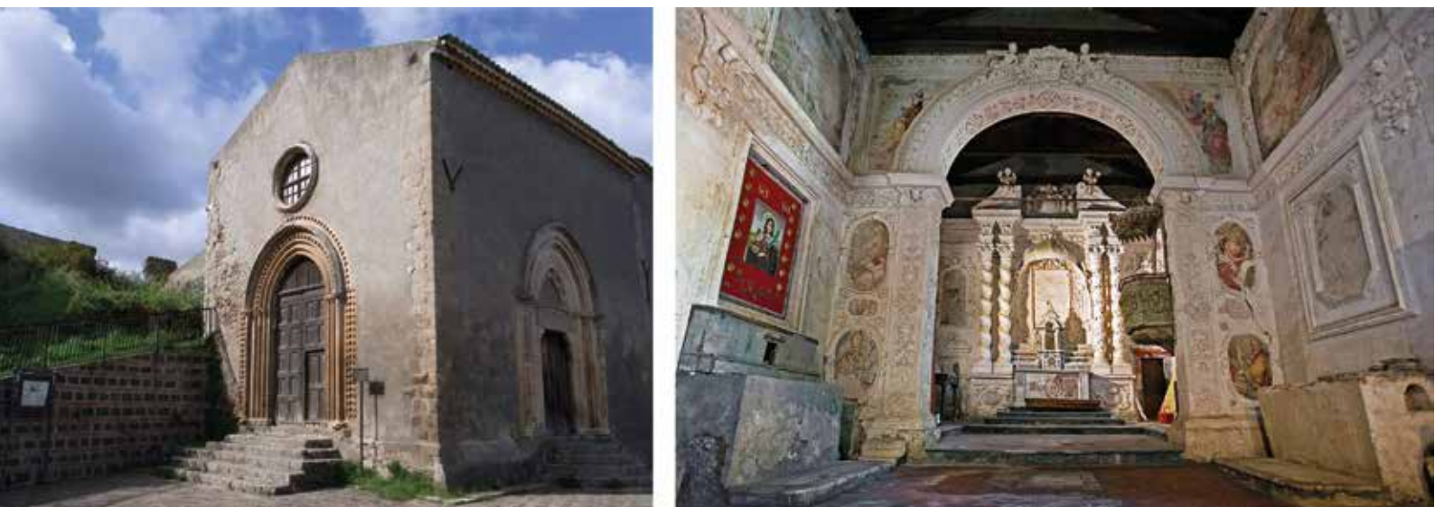
Fig. 1 - Chiesa di San Michele (XIII secolo), Savoca.