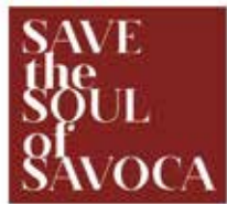
Fig. 2 - Logo e banner della campagna di crowdfunding "Save the Soul of Savoca".