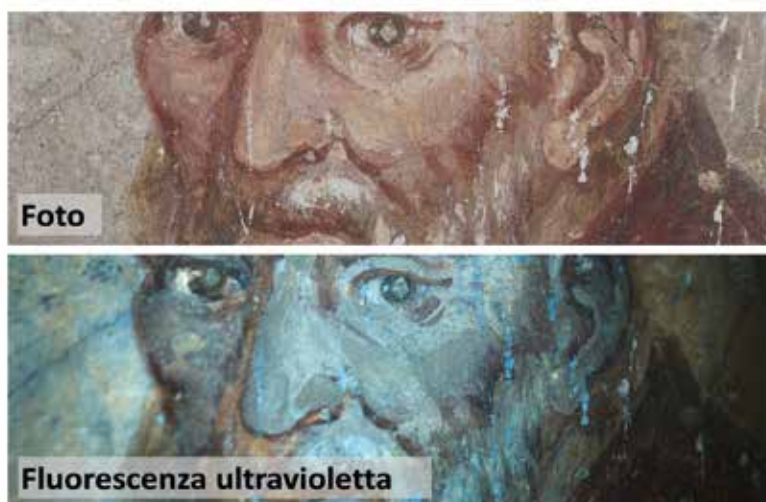
Fig. 6 - Dipinto della parete lato est del transetto, registro inferiore.

Le indagini diagnostiche e la documentazione tecnica rivestono un ruolo molto importante in una campagna di crowdfunding per il restauro di beni culturali. Le informazioni ricavate dagli studi tecnici permettono di capire quando e con quali procedure questi manufatti sono stati realizzati e permettono di progettare interventi di restauro più qualificati. Fra tutte le metodologie di indagine diagnostica, il Cultural Heritage Science Open Source Studio (CHSOS) promuove quelle low-cost che possono essere realizzate con costi contenuti e quindi sono particolarmente adatte ad un progetto di crowdfunding per opere minori, dove i fondi sono strettamente contenuti e limitati all’effettiva conservazione dell’opera piuttosto che a studi diagnostici e tecnici avanzati. La CHSOS ha documentato i dipinti con fotografia infrarossa con camera digitale modificata per l’infrarosso [12], fotografia in luce radente e fotografia di fluorescenza ultravioletta [13] e ha caratterizzato i pigmenti mediante spettroscopia di riflettanza [14]. La fotografia in luce radente non ha rivelato incisioni per definire le figure e nemmeno